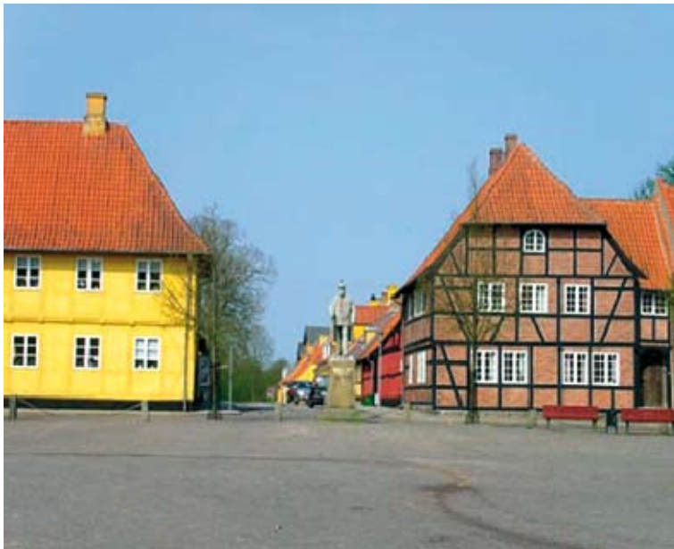
Սորյո քաղաքում է գտնվում Եվրոպայում մինչ օրս պահպանված ամենահին միջնակարգ դպրոցը

մունքում, ունենան համապատասխան կրթություն, տեղեկանք առողջության մասին և բնակվեն պատվիրատուի բնակատեղիից առավելագույնը մինչև 5 կմ հեռավորության գոտում: Դայակների աշխատանքային օրը տևում է առավոտյան ժամը 8-ից մինչև երեկոյան ժամը 20-ը: