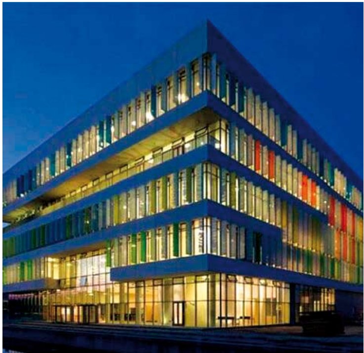
Ժամանակակից դանիական դպրոցի մասնաշենք Օդենսե քաղաքում

Ուսուցչի առաքելությունը ոչ թե աշակերտներին հնարավորինս շատ գիտելիքներ, փաստեր, անուններ, կանոններ և սահմանումներ հաղորդելն է, այլ սովորեցնել հաղորդակցվել, սովորել, վերլուծել և կողմնորոշվել: Ֆուլկետսկուլերի համար անընդունելի են ցանկացած չափորոշիչ կամ կրթական ծրագիր, քանի որ յուրաքանչյուր միջնակարգ դպրոց ունի իր առանձնահատկությունը: Վերջին 15-20 տարում կառուցված դպրոցներում չկան դասասենյակներ և աշակերտական նստարան-աթոռների զուգահեռ դասավորու-