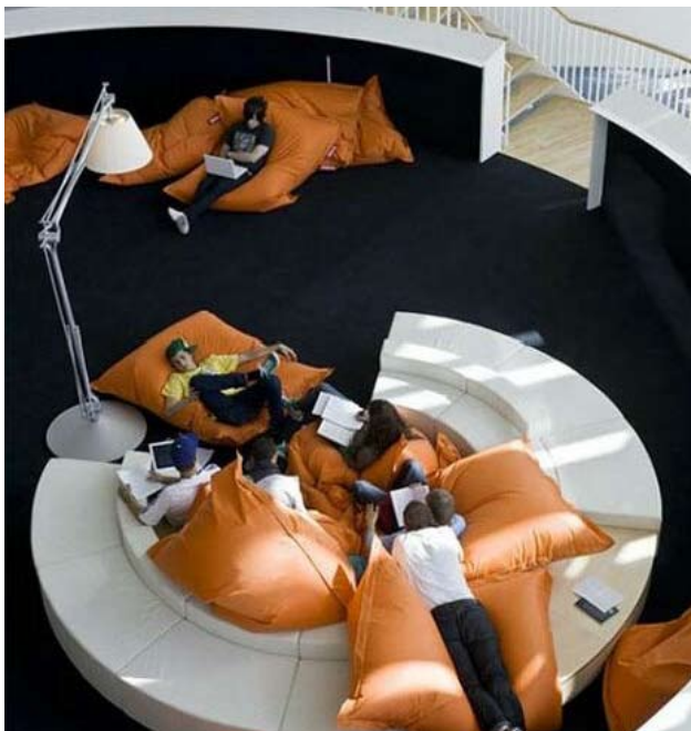
Դպրոցում չկան դասասենյակներ, և դրանց փոխարինում են հարուկ առանձնացված դասապատրաստման անկյուններ, որտեղ աշակերտները չեն կաշկանդվում սեղանաթոռների անհարմարությունից:

թյամբ շարքեր: Դանիայի կրթության (լուսավորության) նախարարի հավաստմամբ, դպրոցը պետք է լինի աշակերտներին զբաղեցնելու, հետաքրքիր առօրյա անցկացնելու, հետևաբար, տարբեր ընդունակություններով օժտված անհատականություններին տարբերակված ուսումնառության հնարավորություններ տրամադրելու համար: