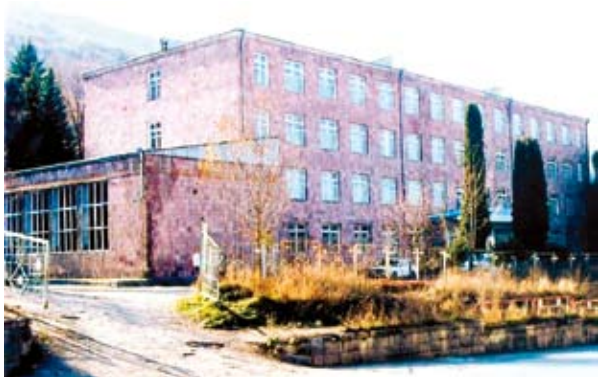
ՎԱՆԱԶՈՐԻ Ս. ԹԵՎՈՍՅԱՆԻ ԱՆՎԱՆ ՊԵՏԱԿԱՆ ՊՈԼԻՏԵԽՆԻԿԱԿԱՆ ՔՈԼԵՋ

Քոլեջը հիմնադրվել է 1965թ. որպես քիմիատեխնոլոգիական տեխնիկում: Այնուհետև 1986թ. վերանվանվել է Ս.Թևոսյանի անվան պոլիտեխնիկական քոլեջ: 2000թ. մարտի 3-ից նրան է միացել Վանաձորի թիվ 47 ուսումնարանը և երկու տարի անց վերանվանվել է Վանաձորի Ս. Թևոսյանի անվան պետական պոլիտեխնիկական քոլեջ: Այժմ քոլեջում սովորում է 300-ից ավել ուսանող: Ուսումնական հաստատության տարեկան շրջանավարտների թիվը կազմում է 100-120 մասնագետ: