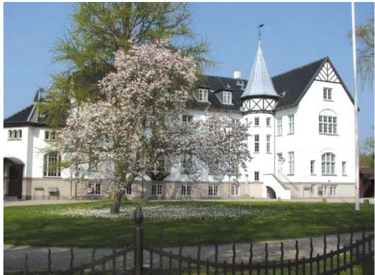
Սոդոյոյի միջնակարգ դպրոցը՝ հիմնադրված 114 թին ի սկզբանե նախատեսված է եղել հարուստների երեխաների համար:

Կրթական գործընթացներն իրականացվում են նախադպրոցական, հանրակրթական, արհեստագործական, տեխնիկատեխնոլոգիական և համալսարանական ուսումնական հաստա-