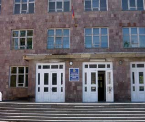
ՎԱՆԱԶՈՐԻ ՊԵՏԱԿԱՆ ԳՅՈՒՂԱՏՆՏԵՍԱԿԱՆ ՔՈԼԵՋ

Գյուղատնտեսական դպրոցը հիմնվել է դեռևս 1925թ.: 1932թ. նրան են միավորվել Իջևանի, Օձունի տեխնիկումները և Կիրովականի անտառ դպրոցը, իսկ 1970թ.՝ դարձել Սովխոզ տեխնիկում: 2001թ. միավորվել են գյուղատնտեսական և գյուղատնտեսաշինարարական տեխնիկումները, և հիմնվել է Վանաձորի պետական գյուղատնտեսական քոլեջ: Այժմ քոլեջն ունի 254 ուսանող: Վերջին տարիներին քոլեջն ունենում է տարեկան մոտ 100 շրջանավարտ: